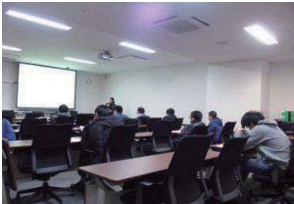
▲本部構内文系URA 室による学振特別研究員制度準備説明会

12月11日・1月15日の2日間にわたり、経済学研究科の大学院生を主な対象とし、経済学研究科主催、プロジェクトセンター共催で、「日本学術振興会特別研究員〔以下、学振〕準備説明会」を開催いたしました。